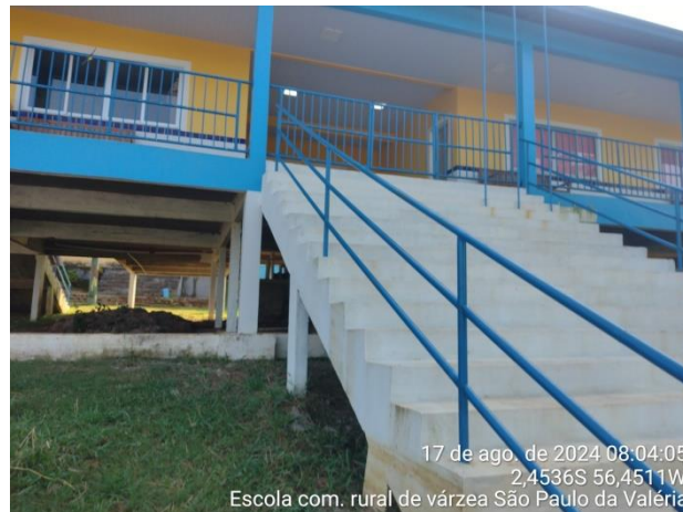
Figura 12: Escada de acesso

17 de ago. de 2024 08:04:05 2,4536S 56,4511W