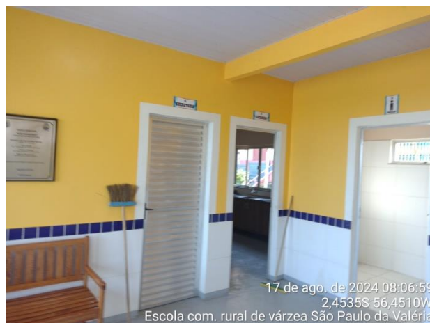
Figura 14: Banheiros.

17 de ago. de 2024 08:06:59 2,4535S 56,4510W