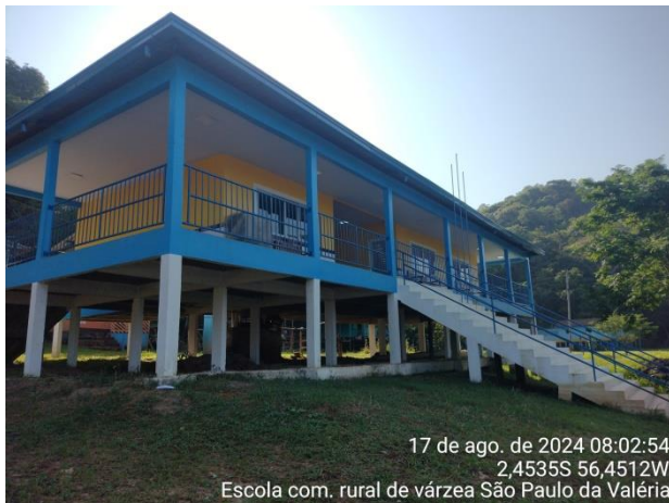
Figura 11: Visão do pilotis.

17 de ago. de 2024 08:02:54 2,4535S 56,4512W