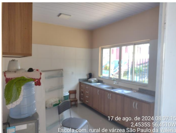
Figura 13: Cozinha.

17 de ago. de 2024 08:07:15 2,4535S 56,4510W