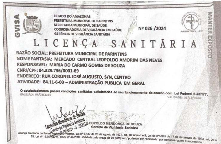
Imagem 02: Licença Sanitária Mercado.