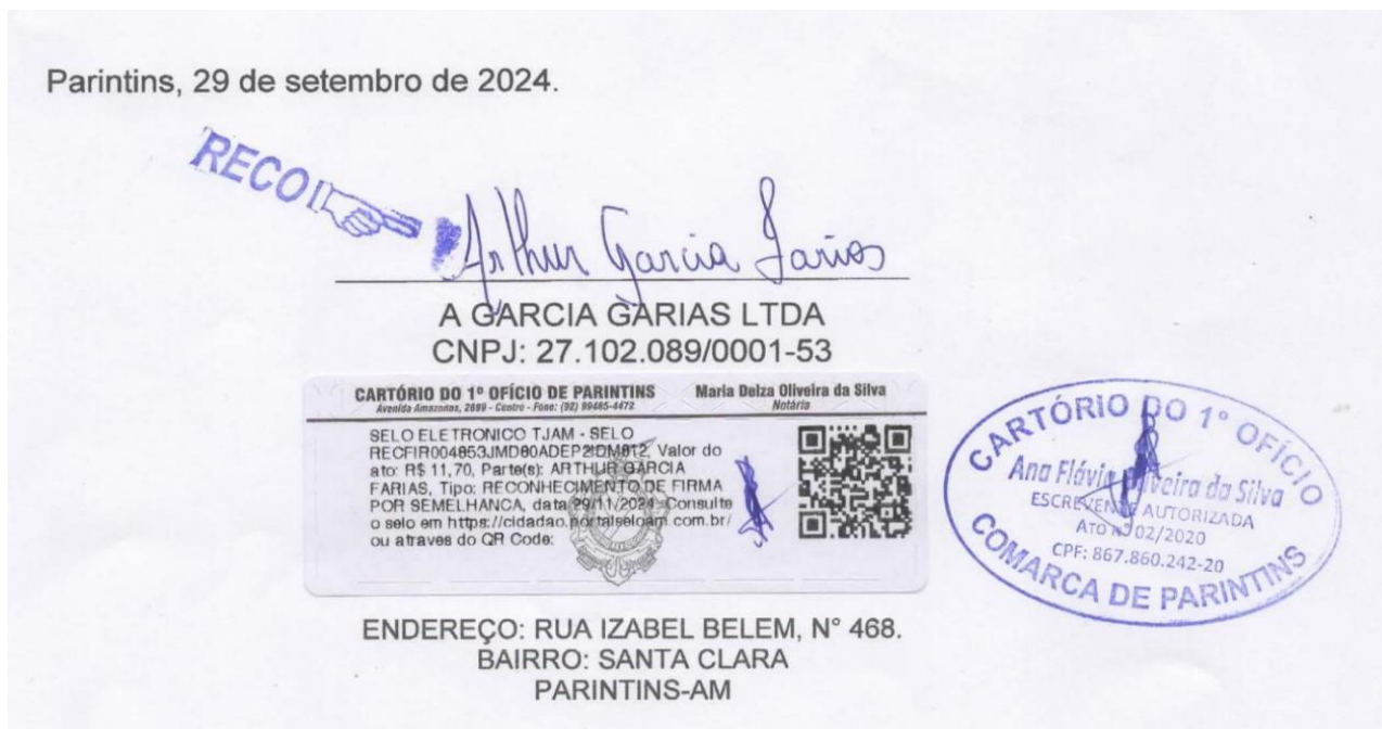
Imagem 01: selo de reconhecimento de assinatura

seria “NOVEMBRO”, tal erro não interfere nos valores e quantitativos apresentados no atestado e a data correta pode ser confirmada através do selo de reconhecimento de assinatura feita no Cartório de 1º Ofício De Parintins.